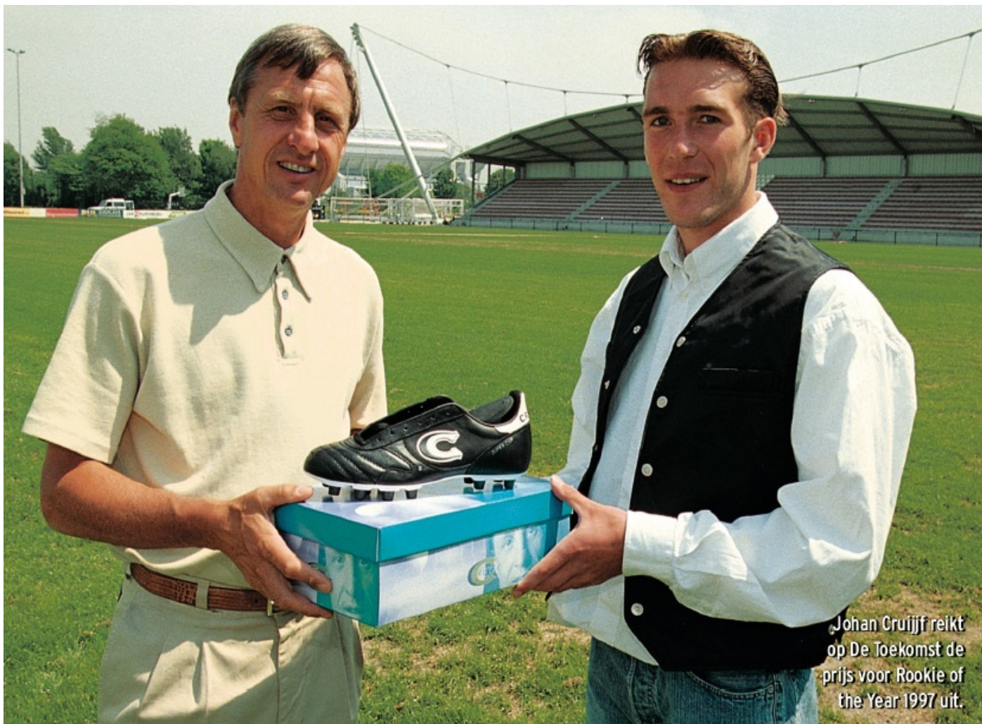
Johan Cruyff reikt op De Toekomst de prijs voor Rookie of the Year 1997 uit.