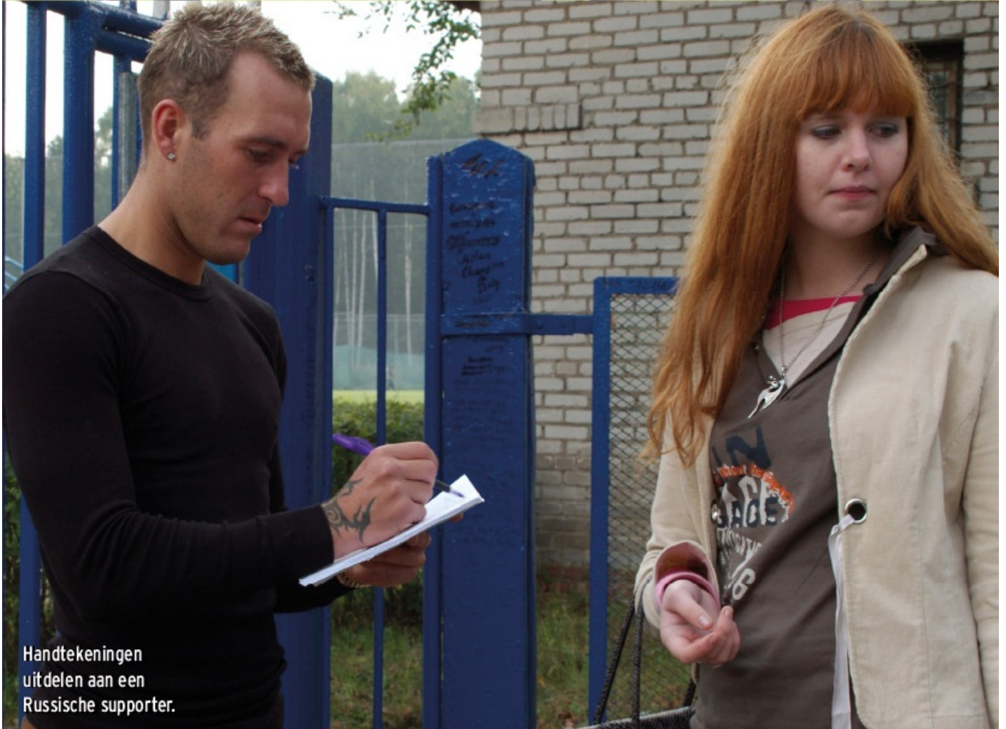
Handtekeningen uitdelen aan een Russische supporter.